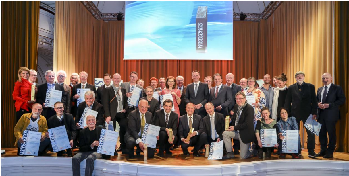
MAECENAS NÖ - Gesamtpreisträger 2020 & 2021 im Sparkassensaal Wiener Neustadt.