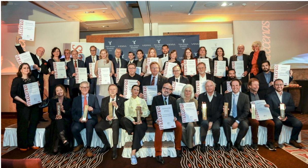
Die MAECENAS Gesamtpreisträger 2020 & 2021 im Rahmen der feierlichen Verleihung.