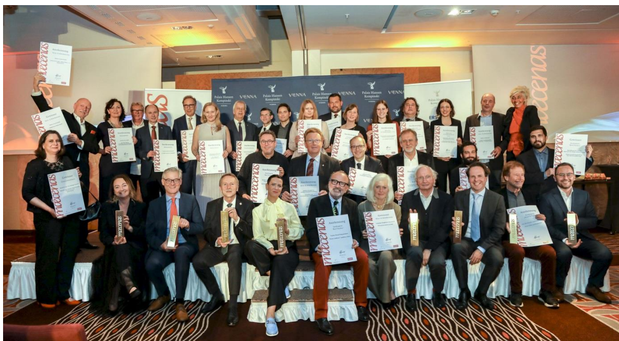
Die MAECENAS Gesamtpreisträger 2020& 2021 im Rahmen der feierlichen Verleihung.