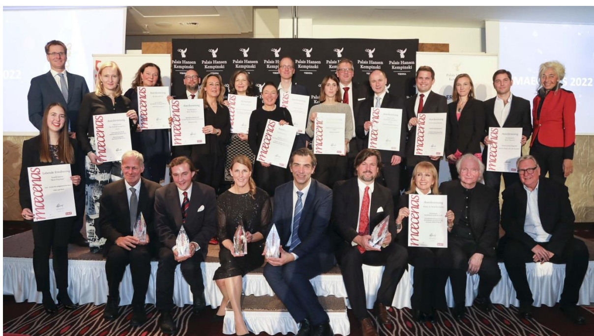
Die MAECENAS Gesamtpreisträger 2022 im Rahmen der feierlichen Verleihung.