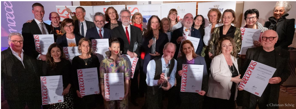
Die MAECENAS Gesamtpreisträger 2023 im Rahmen der 35. MAECENAS-Verleihung.

Auf die Hauptpreisträger warteten speziell für den MAECENAS gefertigte Skulpturen des Künstlers Prof. Christian Kvasnicka : „Maecenas-Gewinner sind Menschen, die sich ihrer Verantwortung gegenüber der Kunst bewusst sind und Projekte erfolgreich umgesetzt haben. Sie erhalten dafür ein Symbol von kultureller Bedeutung, das weit in die Zeit hineinwirkt. Ausgezeichnete sind Träger eines geistigen Vermächtnisses.“